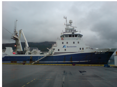
"Båtsfjord" har gjennomgått en energikartlegging og er i full gang med NO x -reduerende tiltak.

COWI er engasjert av Aker Seafoods for å finne energireduerende og NO x -reduerende tiltak i to av rederiets trålere. Hele rederiets trålerflåte er innmeldt i NO x -fondet og to av fartøyene deltar nå i et prosjekt der COWI kartlegger og anbefaler tiltak som kan få støtte tilbake fra NO x -fondet.