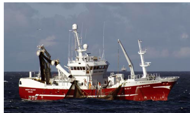
Inger Hildur er en av medlemsbåtene i Energinetverk Fiskeflåte

Norges Fiskarlag og Fiskeri- & Havbruksnæringens Forskningsfond